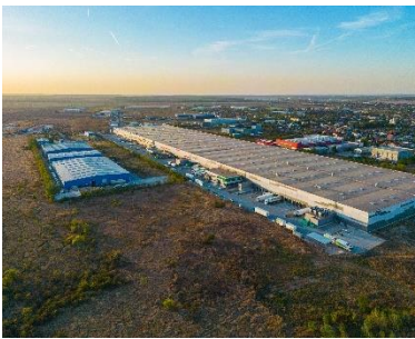
Agglomération de Bucarest

WDP acquiert un portefeuille comprenant 136 374 m 2 de surface locative d'actifs immobilisés ainsi qu'un grand terrain pour le développement futur d'une surface GLA potentielle totale de plus de 300 000 m 2 dans l'agglomération de Bucarest, à Constanta et à Targu Mures, en Roumanie, ce qui représente un investissement d'environ 110 millions d'euros. Le portefeuille se compose de trois projets d'entrepôts de classe A et de bâtiments industriels légers, loués à une variété de locataires haut de gamme. Le vendeur est une joint venture entre Globalworth et Global Vision, des investisseurs immobiliers de premier plan en Europe centrale et orientale.