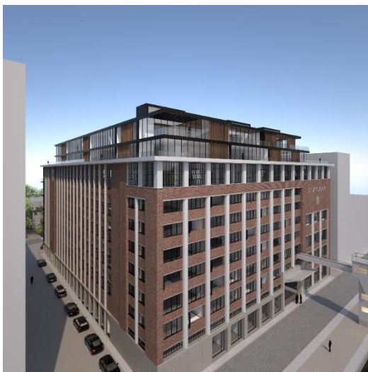
Vaartkom / Eynattenstraat