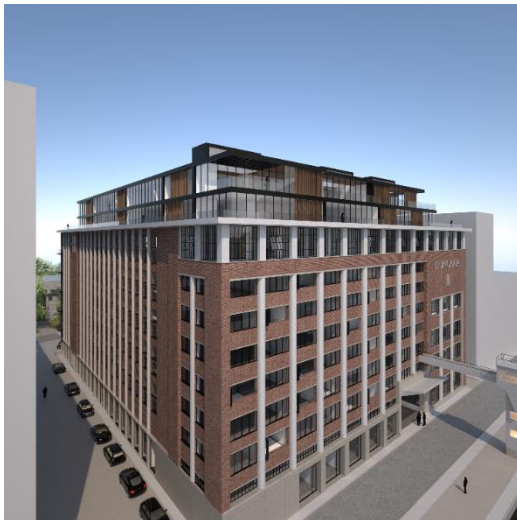
Gevel Vaartkom / Eynattenstraat