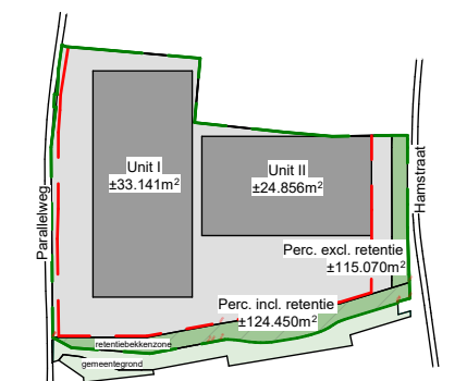
Perceeloverzicht schaal 1 : 10000 gemeente Kerkrade sectie D nr. 10132